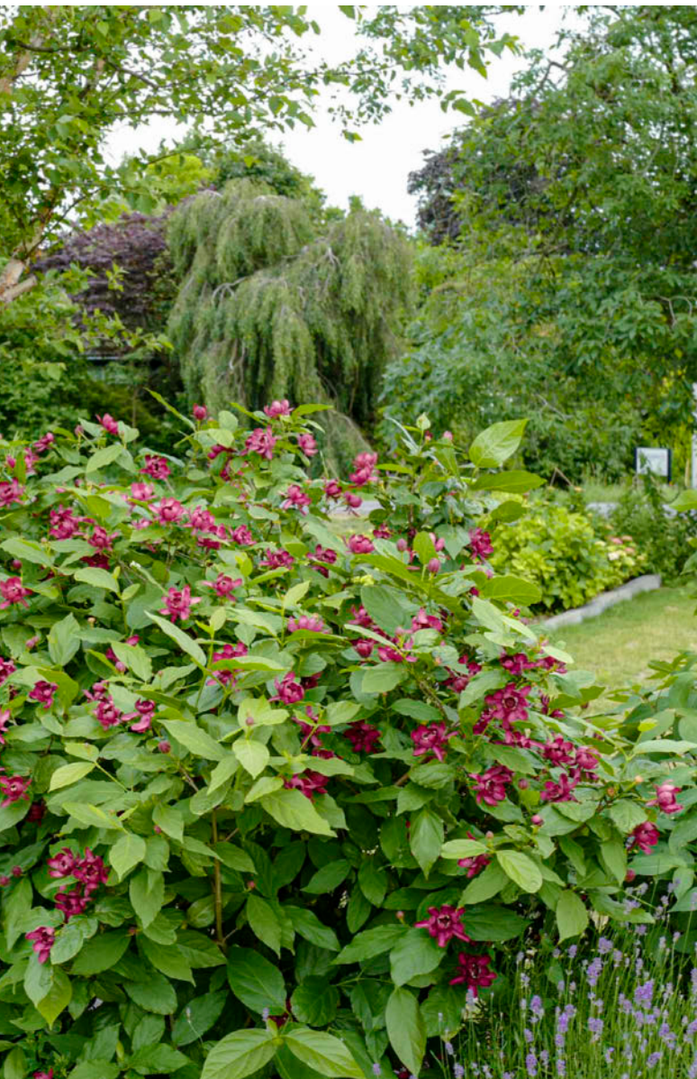
Calycanthus raulstonii 'Aphrodite'