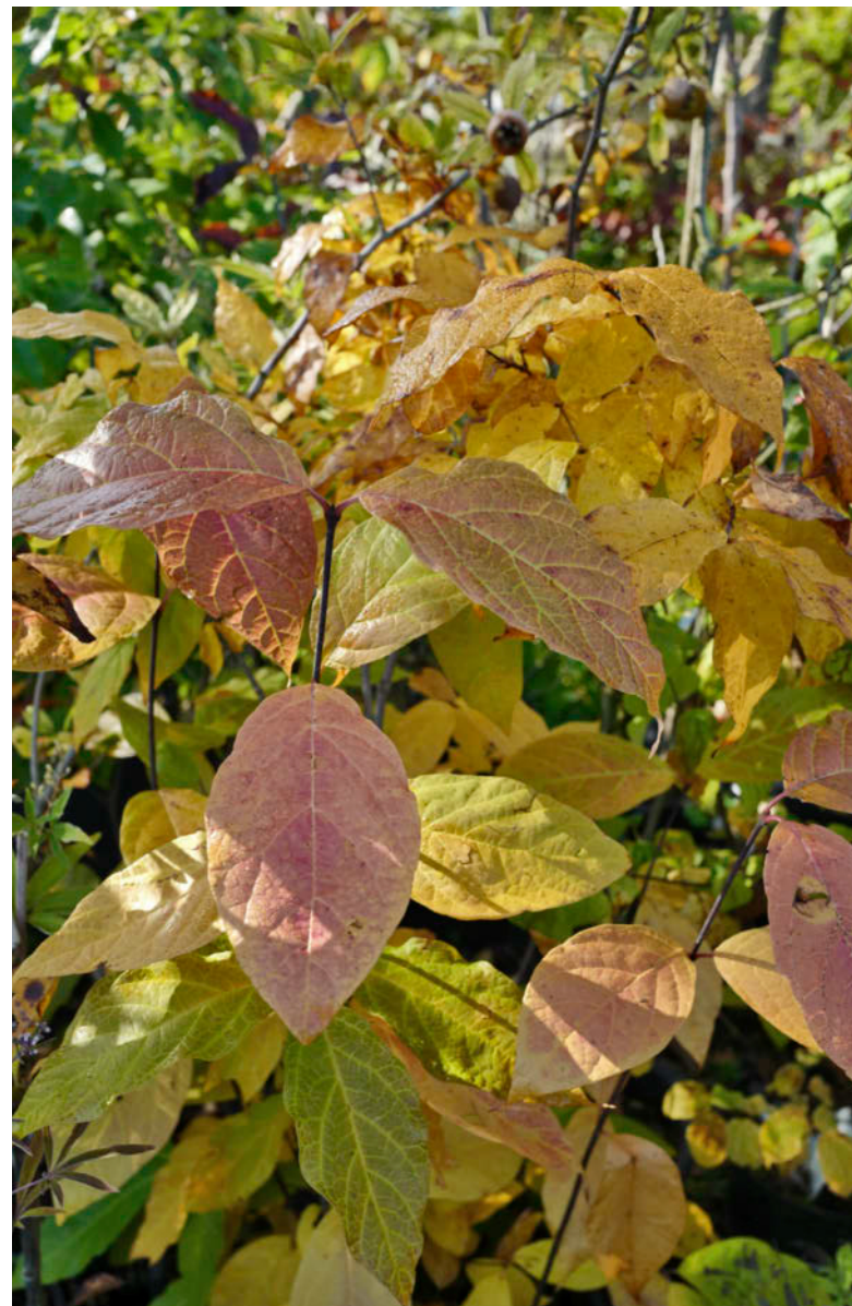
Calycanthus floridus (hierboven en rechts)