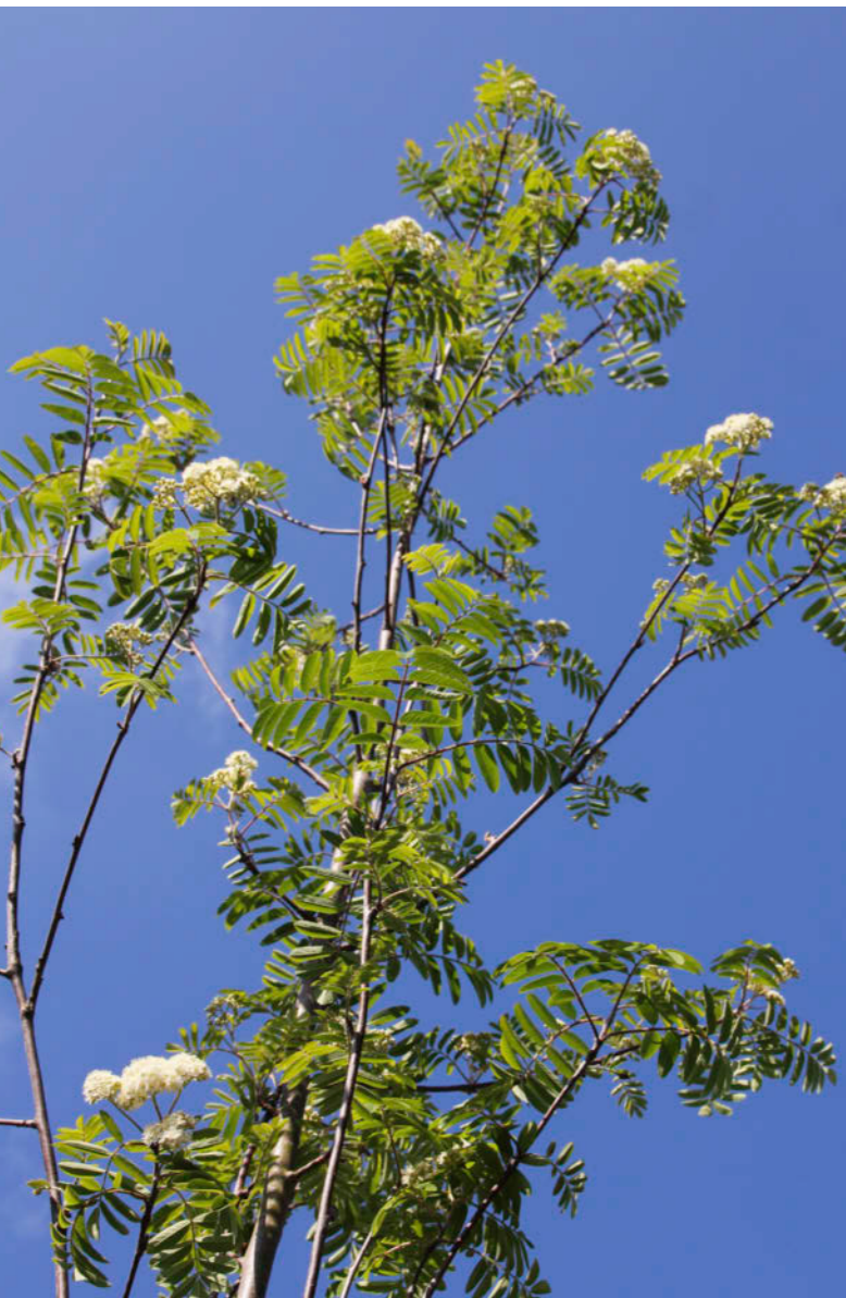
Sorbus aucuparia 'Rossica Major' in bloei.