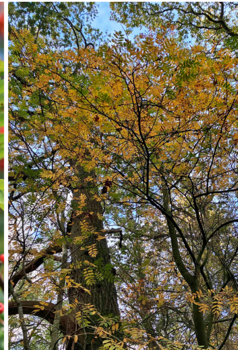
Sorbus aucuparia (hier in herfstkleur) vormt de tweede boomlaag in het bos.

> lichtbehoefte is zonnig tot licht beschaduwde, maar ik kom hem ook regelmatig tegen als tweede boomlaag in het bos. Hier zal de bloei en vruchtzetting dan wel veel minder zijn."