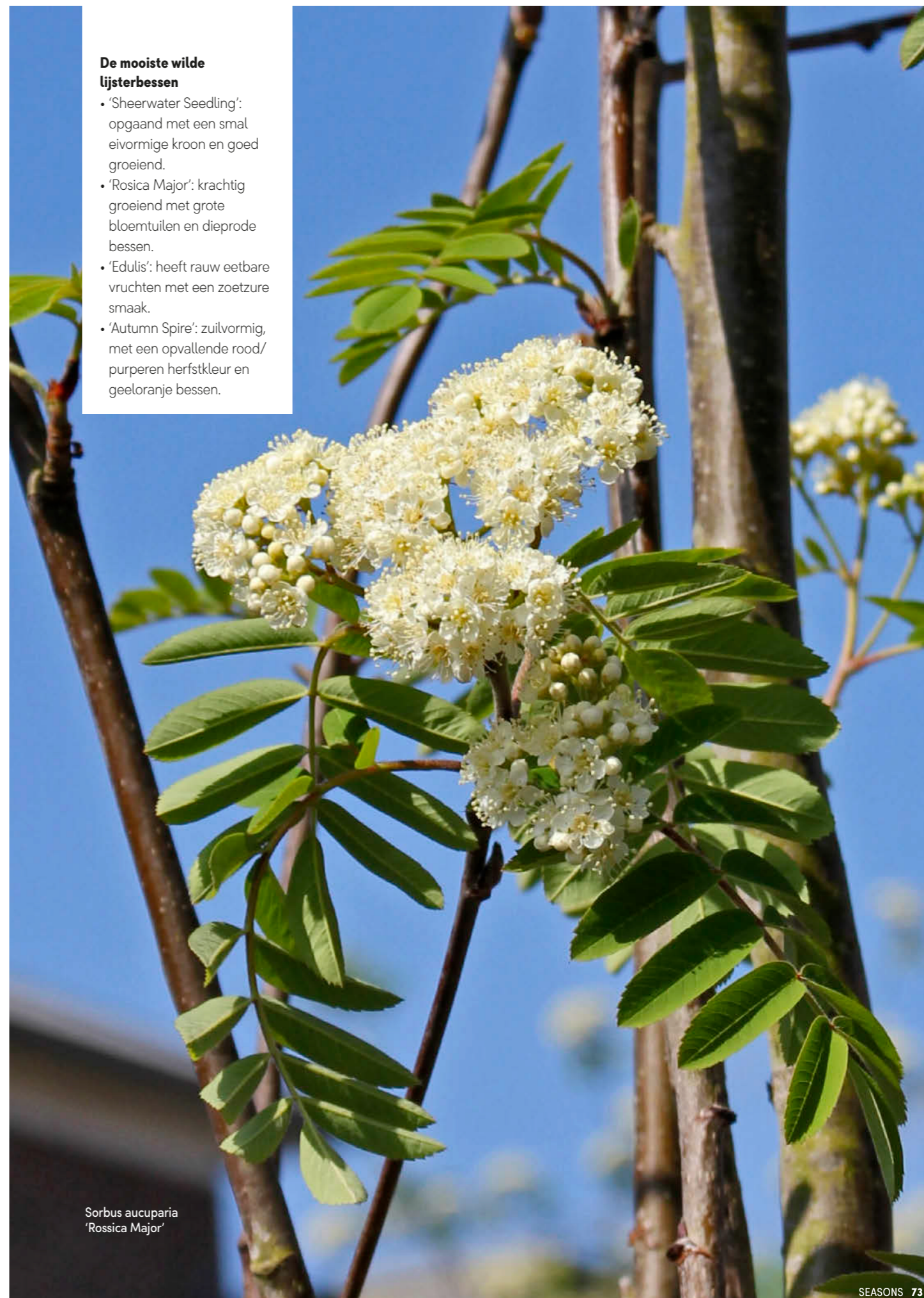
Sorbus aucuparia 'Rosica Major'