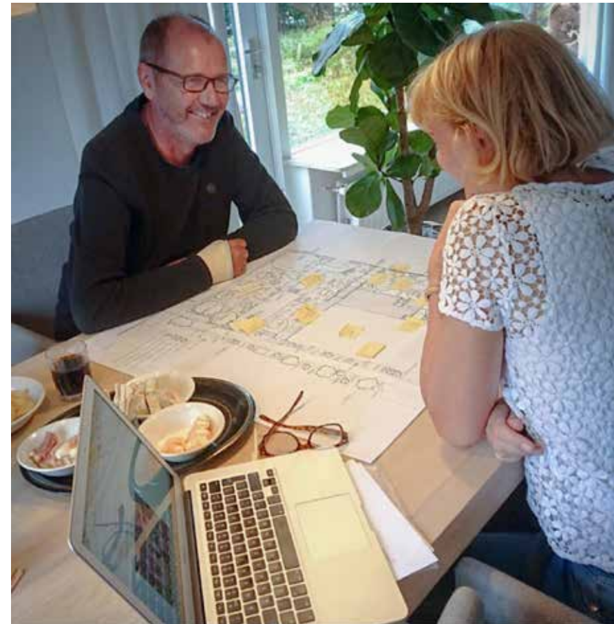
Beplantingsplan en -advies.