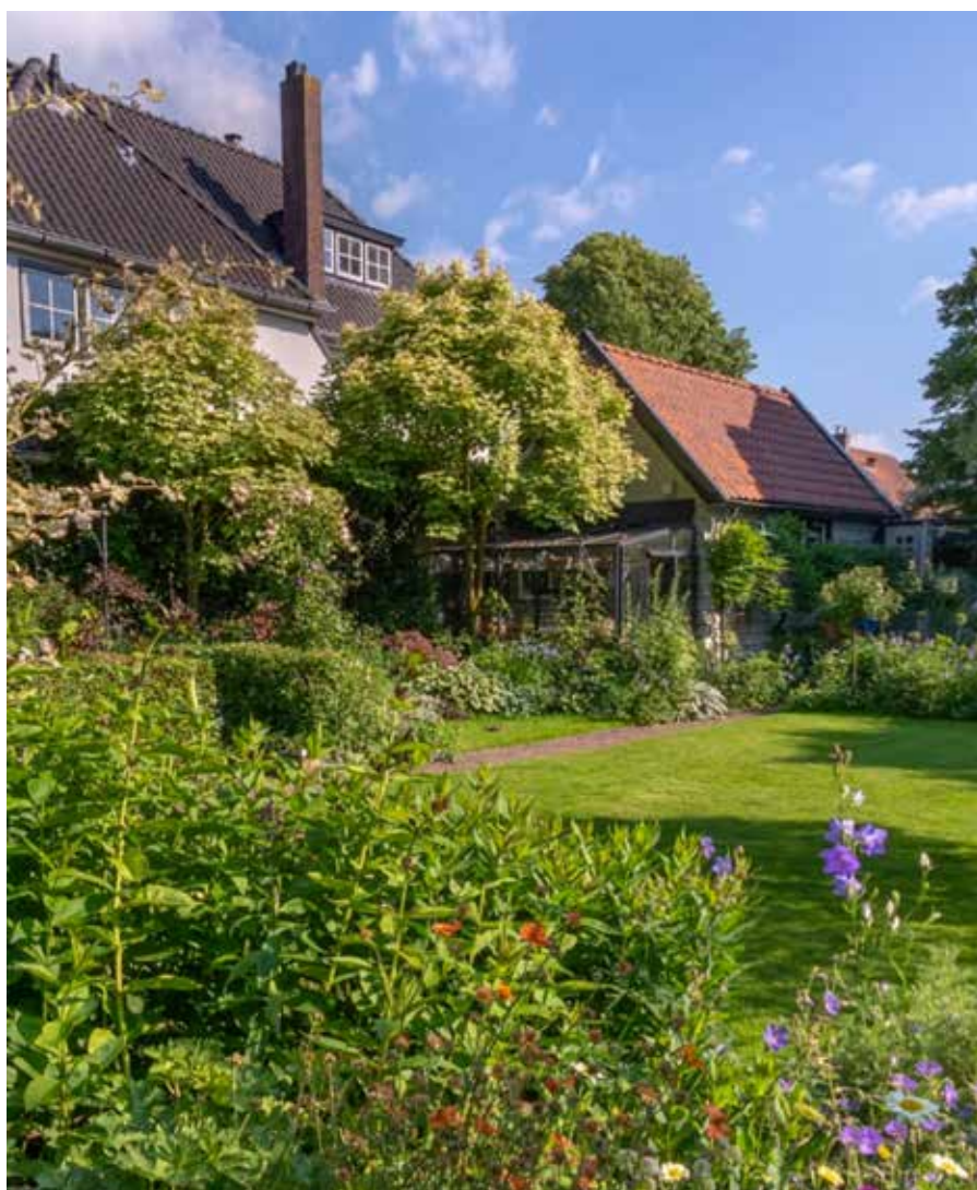
Moet een hovenier in de eerste plaats beplantingsexpert zijn?

Tekst Greenpro | Beeld De Bloeimeesters Zelfportret de VHG