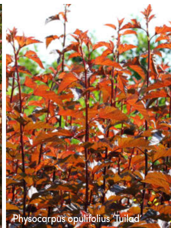
Physocarpus opulifolius 'Tulad'