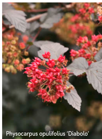
Physocarpus opulifolius 'Diabolo'