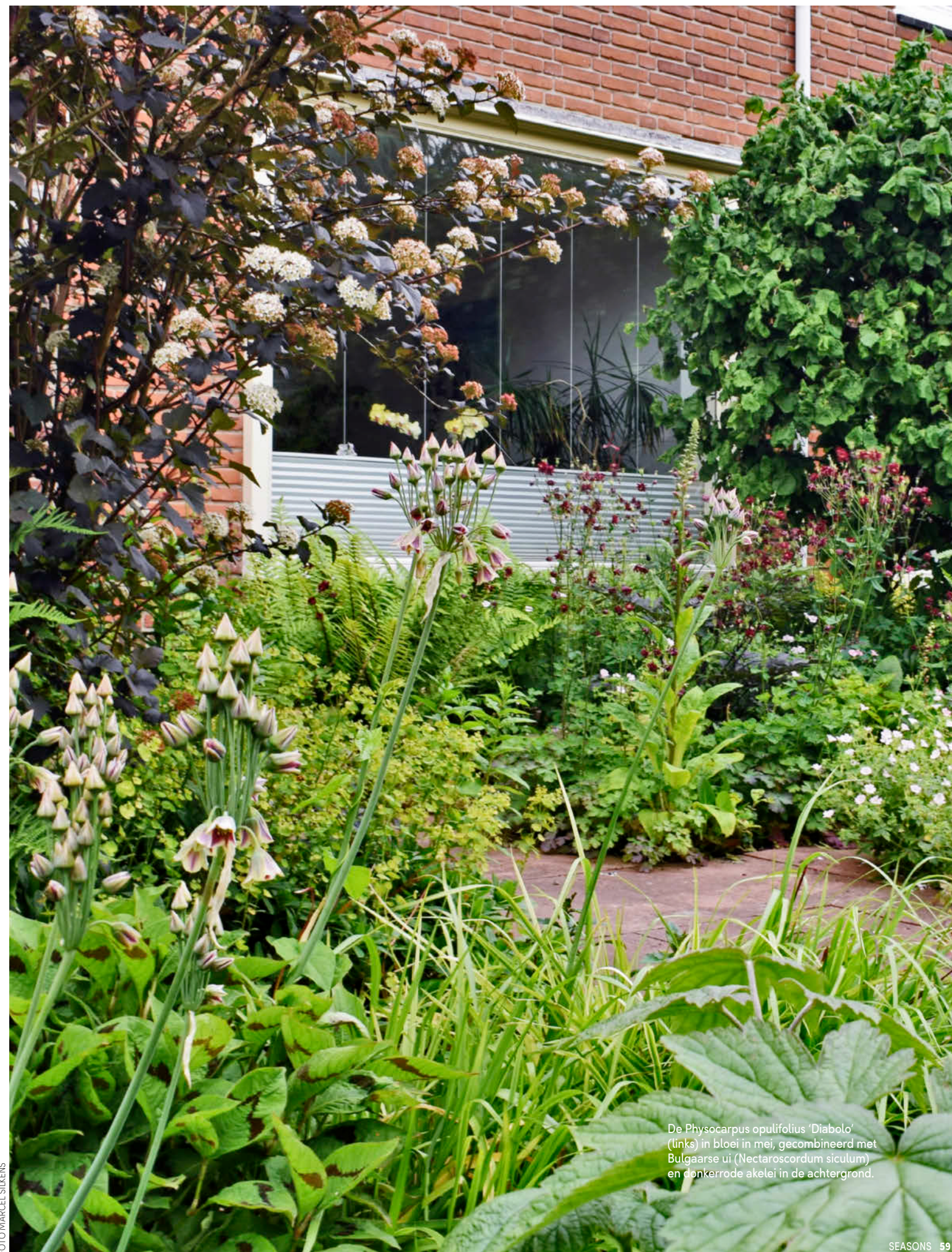
De Physocarpus opulifolius 'Diabolo' (links) in bloei in mei, gecombineerd met Bulgaarse ui (Nectaroscordum siculum) en donkerrode akelei in de achtergrond.

Scan de QR-code voor een filmpje over blaasspirea (Physocarpus opulifolius). In de volgende aflevering: zevenzonenboom (Heptacodium miconioides).