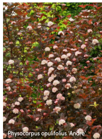
Physocarpus opulifolius 'Andre'